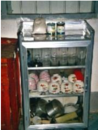
L'armoire fabriquée sur place pour l'éducation nutritionnelle