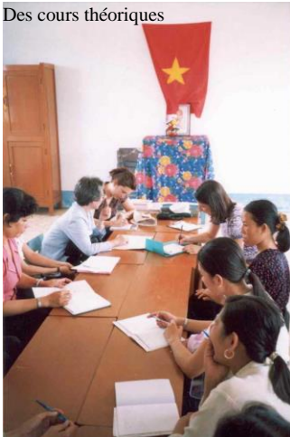
Des cours théoriques