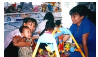
Mme ANH embauchée, et formée pour la salle de jeu