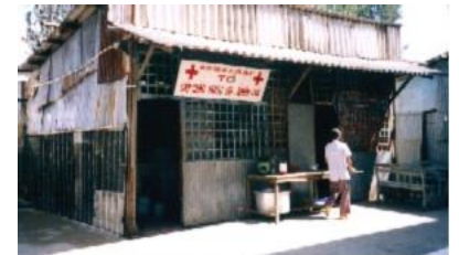
Le « resto du cœur » AVANT ...

Les responsables de l'hôpital souhaiteraient notre participation concernant l'aménagement matériel des locaux plutôt qu'une aide à la construction. A nous d'être imaginatifs et efficaces pour répondre à cet appel justifié.