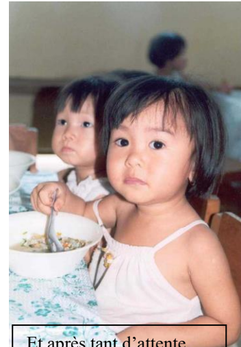
Et après tant d'attente, premier repas servi