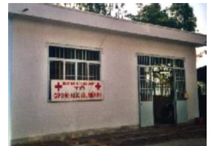
Le « resto du cœur » APRES ...