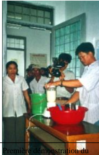
Première démonstration du mixeur devant la télévision locale