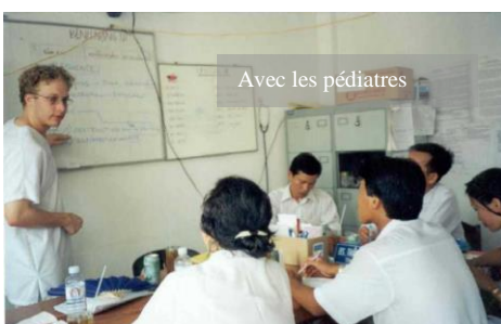
Avec les pédiatres

Révélation professionnelle, tout d'abord dans un travail d'équipe beaucoup plus épanouissant et gratifiant qu'en solitaire à mon goût, et puis aussi d'enseigner mes compétences professionnelles dans le domaine précis de la